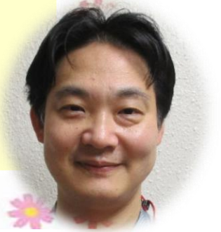
北澤療育指導室長

今年度は、感染対策に配慮しながら、少しずつ集団での療育活動や行事の機会を増やすことができました。セラピードックや学生による音楽演奏など、院外の方との交流も再開しております。次年度以降は、利用者の皆様の安全に十分留意しながら、院外への外出やご家族・後見人様との交流が持てるような機会を広げていきたいと考えております。「コロナ禍」以降、スマートフォンやタブレットを利用してのリモート面会や、離れた場所と中継しながらの行事の実施が可能となるなど、私たちのコミュニケーションのあり方も大きく変化したように思います。新しい技術によりもたらされる利点については、これからも積極的に活用していきたいと考えますが、利用者の方をしっかりとみて、触れて、話かける、というコミュニケーションは私たちの支援の原点でもあります。利用者の方々がご家族・後見人、地域の方々と多くの関わりを持ちながら、新しい発見に満ちた、充実した日々を送っていただけることを心から願っております。